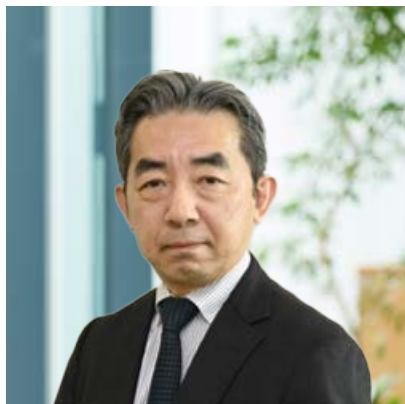
ビジネス推進本部長