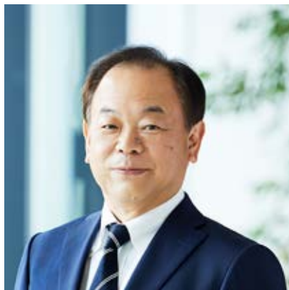
センシングビジネス本部長