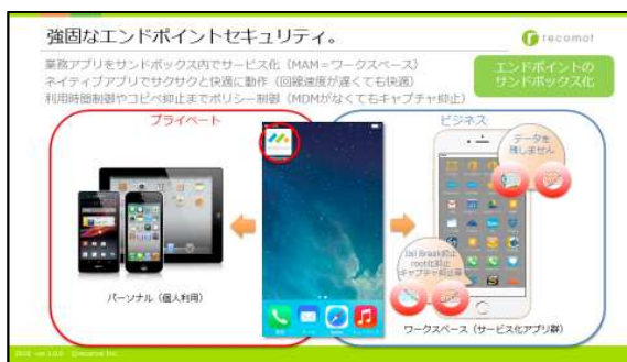
※「moconavi」は株式会社レコモットの登録商標です。