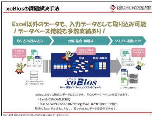
※「xoBlos」はデジタル・インフォメーション・テクノロジー株式会社の登録商標です。